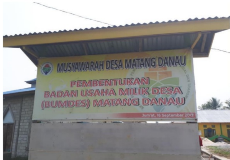
Gambar 1. Spanduk Musyawarah Desa Pembentukan BUM Desa

Adapun mekanisme pembentukan BUM Desa yang dilakukan, secara detail dapat dijelaskan melalui gambar berikut ini: