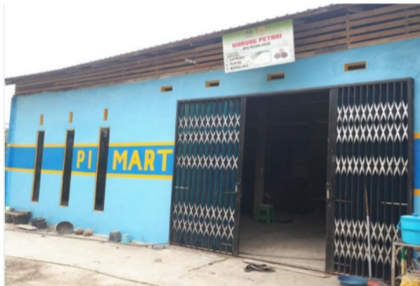
Gambar 3. Toko Pupuk Bersubsidi

Hasil wawancara diperoleh keterangan bahwa di samping baru sebagian masyarakat yang mendapatkan manfaatnya, juga pendapatan yang diperoleh oleh pengelola BUM Desa masih relatif kecil.