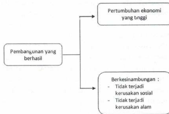
Gambar 1.1 Unsur-unsur Pembangunan yang Berhasil

Dengan demikian, seperti juga masalah kerusakan alam yang dapat mengganggu kesinambungan pembangunan, faktor keadilan sosial juga merupakan semacam kerusakan sosial yang bisa mengakibatkan dampak yang sama. Kerusakan sosial ini antara lain dapat diukur oleh Indeks Gini dan tingkat kualitas kehidupan fisik seperti yang dicerminkan oleh tolok ukur PQLI. Karena itu, dapat dirumuskan bahwa pembangunan yang berhasil mempunyai unsur-unsur seperti pada Gambar 1.1.