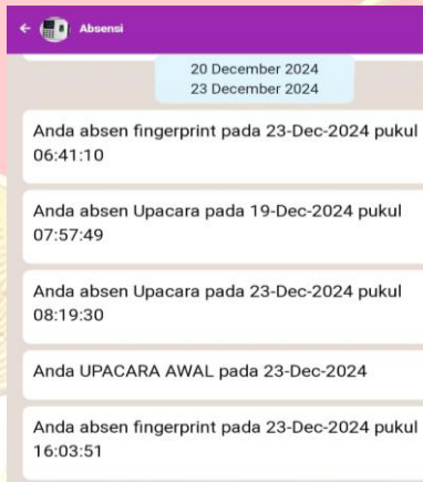
Gambar 3.4 Fitur Si e-Wi Monitor Absen

Berdasarkan hasil wawancara menunjukkan bahwa dengan adanya sistem absensi sidik jari, pencatatan kehadiran pegawai menjadi lebih transparan. Sistem absensi sidik jari mengurangi kemungkinan penyalahgunaan data karena setiap pegawai dapat melihat riwayat kehadirannya sendiri secara real-time .