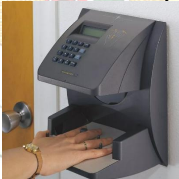
Gambar 3.1 Mesin Absensi Handkey

Penulis melakukan observasi terhadap riwayat pelaksanaan absensi kehadiran pegawai pada Kelurahan Kalisari Kecamatan Pasar Rebo Kota Administrasi Jakarta Timur. Hasil observasi menunjukkan bahwa awalnya Kelurahan Kalisari masih menggunakan absensi manual dengan menggunakan kertas dengan memberikan laporan berkala kepada pimpinan. Karena kemungkinan adanya manipulasi dan pengolahan data yang memakan waktu lama, sistem ini dianggap kurang efisien. Kelurahan Kalisari kemudian beralih ke penggunaan mesin absensi handkey , alat yang mengidentifikasi kehadiran pegawai melalui pemindaian telapak tangan, untuk meningkatkan akurasi dan transparansi. Meskipun sistem ini lebih canggih daripada metode manual, masih ada celah untuk memanipulasi data jika operatornya tidak amanah.