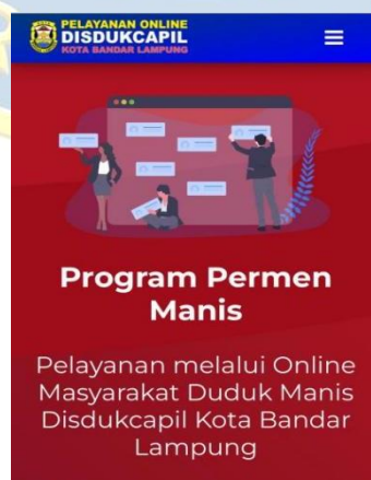
Gambar 4.1 Aplikasi permen manis